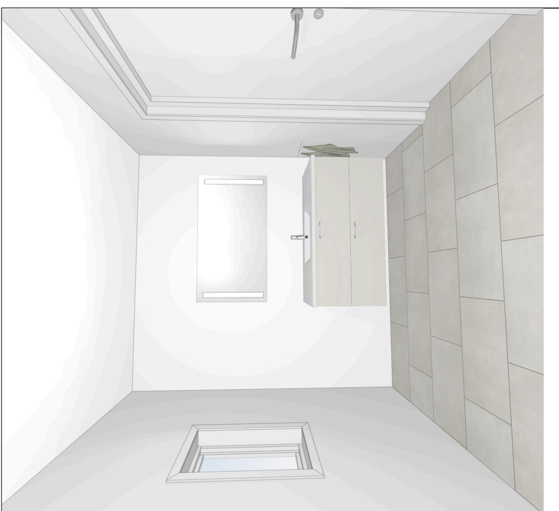
Skala: Tilpasset ramme