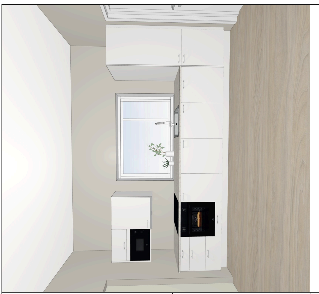
Skala: Tilpasset ramme